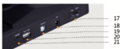
Porte di connessione